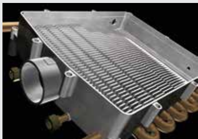
ROTEX Smart Condens con aletas rectas